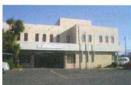
本社(埼玉県児玉郡上里町)

レセ楽net ホームページはこちら http://recerakunet.com/