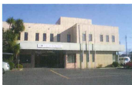
本社(埼玉県児玉郡上里町)

資料請求 ▶▶ http://radianceware.co.jp/ RAD ラジエンスウェア株式会社 営業企画部 | 〒369-0313 埼玉県児玉郡上里町堤 696-7 TEL:0495-35-0081 FAX:0495-35-0075 E-mail:radiance@radianceware.co.jp