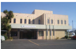
本社(埼玉県児玉郡上里町)