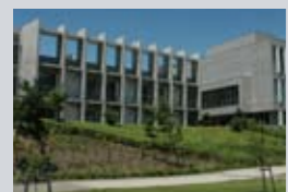
早稲田リサーチパーク 産学連携施設 IOC本庄早稲田