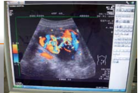
▲ 画像ファイリング

診療支援でドクターの負担を軽減する、 メディカルハイウェイの構築を目指しています。